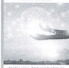
Table of Content - Volume 1 | Issue 6 (Dec 2021)