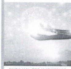
Table of Content - Volume 1 | Issue 6 (Dec 2021)