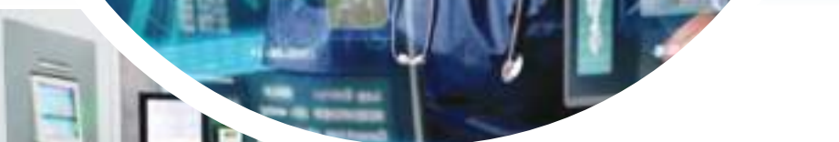
давлатларга махсусотларимизни етказиб бераймиз.

Энг охириги ишлаб чиқарган дориларимиздан бири — лютеций-177-ПСМА-617 простата бези саратони ва метастазларини даволашда самарали ишлатилапти. Ўтган йилнинг октябридан шу кунга қадар саратонга чалинган оғир аҳволда