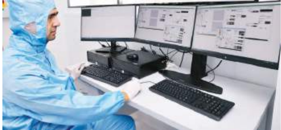
“Радиофармацевтик” давлат корхонаси ядровий тиббиёт учун препарат ва бирикмалар, шунингдек, радиоактив изотопли махсусотлар ишлаб чиқаради. Махсусотларни Республикаимизнинг бир қатор клиникаларига етказиб бериш билан бир қаторда, МДХ, Европа давлатлари, АҚШ, Канада, Бразилия, Япония, Хитой каби