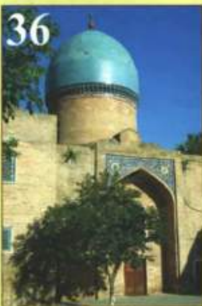
Шайх Хованд Тахурнинг кулоҳи