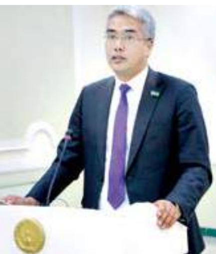
Шерзод ҚУЛМАТОВ, Олий Мажлис Қонунчилик палатаси депутати

Мамлакатимиздаги ислохотлар, бунёдкорлик шуқуқи, маънавий-маданий ишлар самараси сирдарёликлар ҳаётига ҳам янгича мазмун киритмоқда. Зеро, вилоятда сўнгги 6 йилда бир неча ўн йилликларда амалга ошмаган ишлар қилинди.