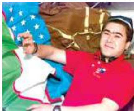
Солижон Шарипов Ўзбекистон байроғи билан космик кемادا.

Ўзбек халқининг яна бир фарзанди, учувчи-космонавт Солижон Шариповни айтиб ўтиш жоиз. 1997 йил ёзда Солижон Шарипов АҚШнинг кўп марта фойдаланиладиган Space Shuttle космик кемаси бортида парвозга тайёргарлик кўриш учун АҚШга борди. 1998 йил январиди "Endeavour" космик кемасида 8 кун 19 соат 47 дақиқа давом этган