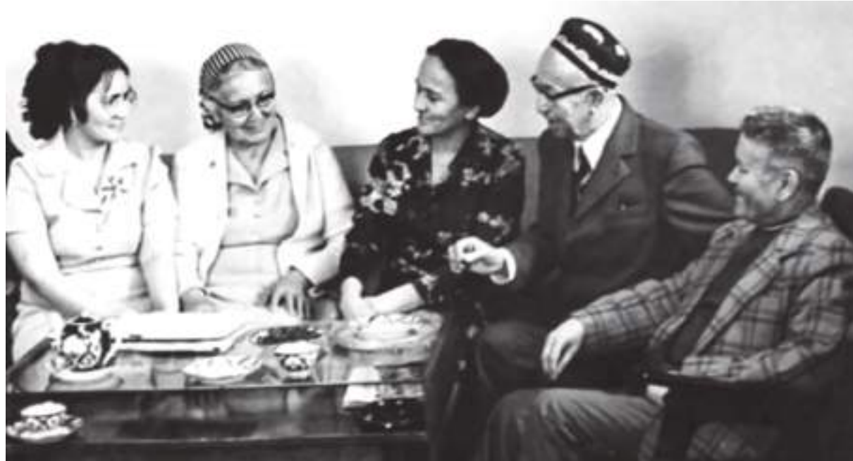
Архив сурати. Музайяна Алавия чапдан иккинчи.

Чўлпон ўша уйда рус хотини билан тураркан. Рус хотини Андиждондан меҳмон бўлиб келган