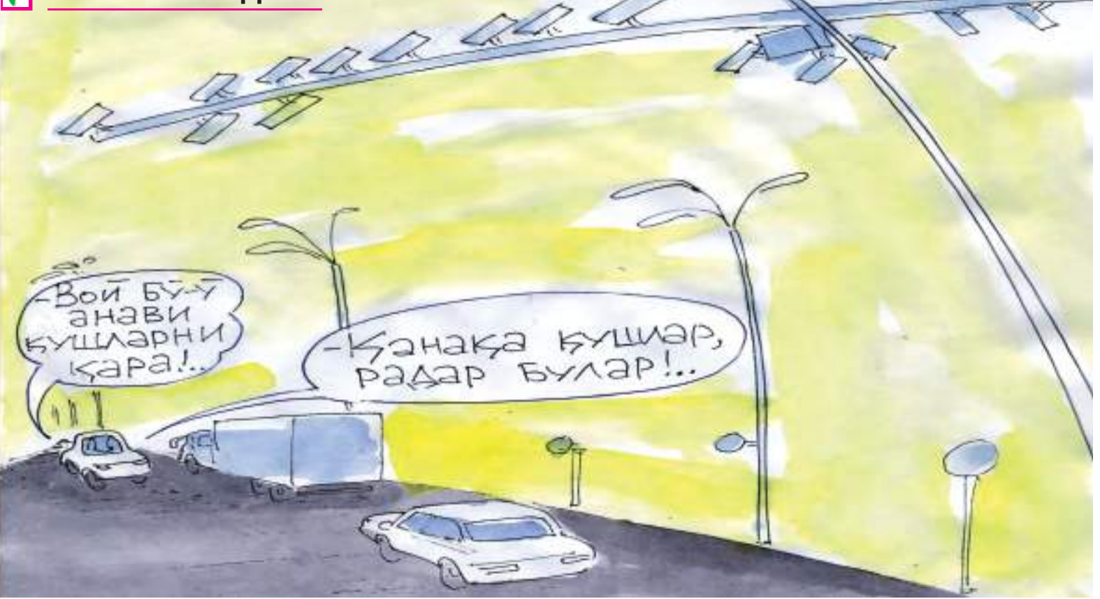
Хусан СОДИҚОВ чизган карикатура.