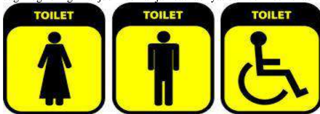
Jamoat hojatxonalarini belgilari: erkaklar, ayollar, nogironlar uchun

Nogironlik jismoniy, hissiy va aqliy zaiflashuvlar ijtimoiy munosabatlarga va zarur texnologiyalar yoki xizmatlarning yetishmasligiga duch kelganda yuzaga keladi. Bir tomondan, jamiyat nogiron kishilarga jinsiy mansublikni rad etadi va bu eng oddiy misol - davlat muassasalaridagi hojatxonalaridagi belgilar (rasmga qarang). E'tibor bering, O'zbekistonda jismoniy to'siqlarning ko'pligi, maxsus jihozlangan transport vositalarining yo'qligi, binolarga kirish joylari, liftlar va jamoat joylari sababli ma'lum bir turdagi nogironligi mavjud insonlar jamoat faoliyatidan voz kechishadi.