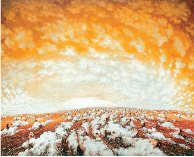
Görsel 3: Ekrem Kahraman, “İçim Kaynar Kar, Sımsıcak Çukurova”, 90x110 cm, T.Ü.Y.B. 1983

Ekrem Kahraman, 1983 yılında yaptığı “İçim Kaynar Kar, Sımsıcak Çukurova” adlı eserinde hafif, yumuşak ve çıplak kıvrımlardan oluşan uçsuz bucaksız bir ovanın resmi görülmektedir. Resmin genelinde beyaz, sarı ve kahverengi tonları hakimdir. Açık kompozisyon olan bu tabloda geniş, parçalı bulutlu bir gökyüzü vardır. Tablonun isminden de anlayacağımız üzere Çukurova’da, pamuk tarlalarında çalışan yüzlerce işçi tarlayı hasat etmektedir. Gökyüzünde kullanılan kızılıklar yeryüzündeki toprakla, gökyüzündeki bulutların rengiyle yeryüzündeki pamukların rengi benzerlik gösterir. Ayrıca topraktaki kahverengi renklerin arasında kullanılan koyu mor renkleriyle kontrastlık oluşturulmuştur.