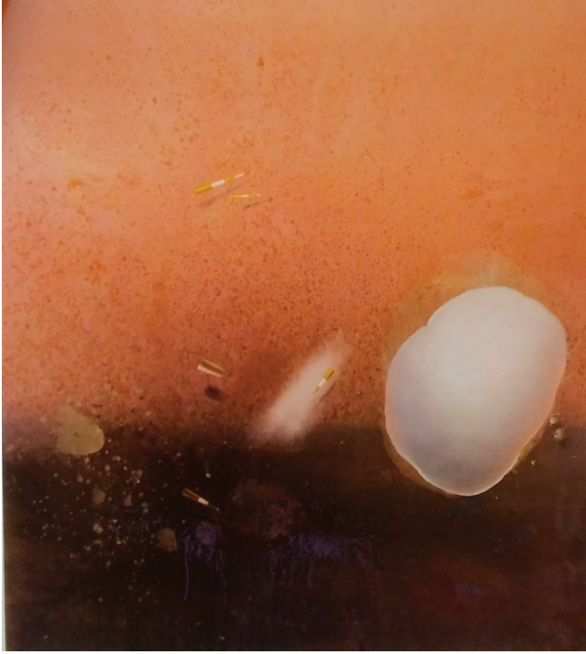
Görsel 5: Ekrem Kahraman, “Görsel Farklılık Uygurlığı” 200x185cm, T.Ü.Y.B., 2014

“Farklılık Uygurlığı” adlı (görsel 5) eserde tuval yüzeyinin yarısından fazla alanı turuncu geri kalan kısım ise kahverengidir. Bu kahverengi alandan yukarıya doğru aynı renkler püskürtülerek taşınmış, resimde bütünlük sağlanmıştır. Ayrıca bu renge mavi renkler püskürtülmüş, renkler zenginleştirilmiştir. Resmin sağ kısmının iki farklı rengin birleştiği yerde büyük oval bir bulut görülmektedir. Bulutun alt kısmına ve yanlarına bir ışık çarpmış gibi parlak renkler verilmiştir. Eserin ortasında açık renk eğik bir leke, hemen üzerinde ters bir trafik konisi boyanmıştır. Bu koniler üst yüzeyde iki yatay şekilde olmak üzere bir tane de alt yüzeyde vardır. Ortada da silindirik şeklinde sarı bir form vardır. Tüm bu şekiller koyu kahverengi ve siyah düşen gölgeleriyle resmedilmiştir.