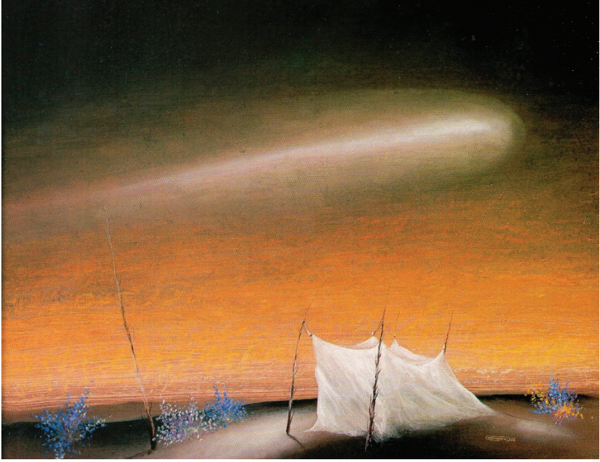
Görsel 4: Ekrem Kahraman, “Uyku ve bir Zamanlar”, 45x58cm, T.Ü.Y.B., 1988

Ekrem Kahraman'ın Zeynep-Nezihi Kemer Koleksiyonunda olan görsel 4'deki eserinde sarı ve kahverengi hakimdir. “Uyku ve bir Zamanlar” adlı resimde mekan çizgisi resmin altında olduğundan geri kalan geniş yüzey gökyüzüne ayrılmıştır. Gökyüzü çok koyu kahverengiler ve siyah renkle başlarken beyaz tonlardaki bir ışık huzmesiyle kendisini turunculara ve sarılara bırakmaktadır. Resmin odak noktası olan çadır, bir cebinliği andırır. Transparan beyaz renkte olan bu çadırın tülleri soldan esen hafif rüzgarla dalgalanır. Çadır kuru olduğunu düşündüğümüz birkaç ağaç dalıyla tutturulmuştur. Aynı ağacın benzerinin daha uzun olanını resmin sol tarafında da görülmektedir. Yeryüzünün çıplak, yumuşak tepelerden oluştuğu anlaşılmaktadır. Tam çadırın önünden geçen bir yol ya da gökyüzündeki huzmenin yansımasından oluşan yerdeki aydınlık, huzmenin renklerini taşımaktadır. Ayrıca mavi, turuncu ve beyaz renklerdeki fırça darbeleriyle çalılıarı andıran çiçekli bitkiler yapılmıştır.