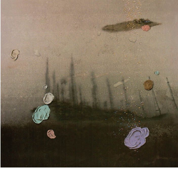
Görsel 6: Ekrem Kahraman, “Dünyanın Görünümü”, 205x205cm, T.Ü.Y.B, 2014

boşlukta asılmış gibi durmaktadırlar. Tüm bu objeler, aslında şehir hayatının tam da ortasında bulunması gerekiyorken ıssız bir doğa görüntüsüne yansıtılarak tezat bir durum yaratılmıştır. Buradaki imgeyle, kutsal bir doğallık sahnesinde “insanın doğaya müdahalesi” anlatılmaktadır.