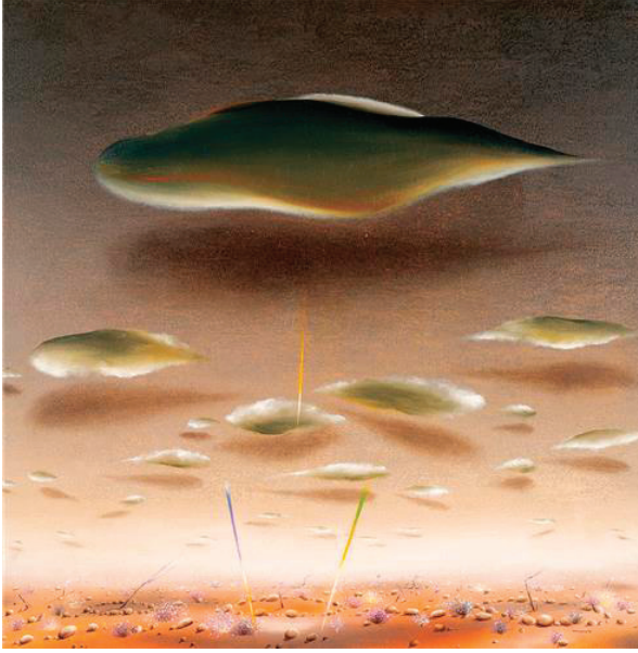
Görsel 2: Ekrem Kahraman, İsimsiz, 110x110cm, TÜ.Y.B, 1990

Fatoş Yunus Büyükkuşoğlu Koleksiyonunda bulunan görsel 2'deki isimsiz eserinde ufuk çizgisinin resmin çok altında kaldığından çok geniş bir gökyüzü görülmektedir. Bu uçsuz bucaksız gökyüzü çoğu resimlerinde geniş alanlar olarak yer alır. Yukarıda bir ucu yuvarlak diğer ucu sivri oval şeklinde bir bulut mevcuttur. Altında benzer şekilde, daha küçük bulutlar tekrarlanmıştır. Yeryüzündeki ıssız düzlükte bol miktarda taş figürleri bulunur. Bazı taşlar gelişigüzel yerleştirilirken, bazılarıyla bir çember oluşturulmuş ve bu çemberin içlerinde kuru ağaçlar ya da dalları eklenmiştir. Çevre çalı şeklindeki çiçeklerle süslenmiştir. Ayrıca zeminin ortasında iki tane, dallardan çok daha uzun çubuklar vardır. Aynı çubuğun belli belirsiz görüntüsü gökyüzünün tam ortasında da bulunmaktadır. Gökyüzü koyu gri renklerden aşağıya doğru yavaş yavaş sarılaştığını ve kendisini ekru rengine bıraktığını görülmektedir. Kullanılan gri renginin içindeki morlarla sarı tonları kontrastlığı oluşturmuştur. Bulutların ışığı alan yüzeyleri parlaklaştırılırken gölgede kalan yerleri koyu lekelerle gölgelendirilmiştir. Bu anlayış, eserin genelinde hakimdir.