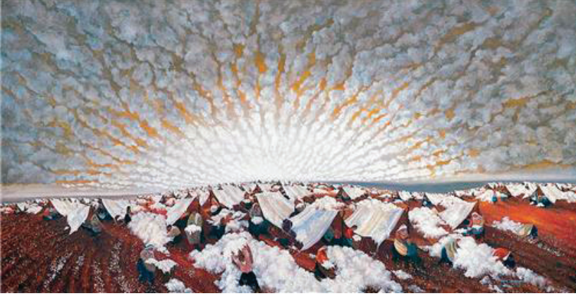
Görsel1: Ekrem Kahraman, "Çocukluğum O En büyük Çukurova", 100x200cm, T.Ü.Y.B, 1983

Bugün yaptığı resimlerde -direkt Çukurova ile ilgili görünüm olmasa da- gökyüzü ve yeryüzü ayrımının soyutlaşarak devam ettiği görülmektedir. Bu doğrudan yaşamının başlangıcı olan yerlere yönelik bir eğilimin ifadesidir.